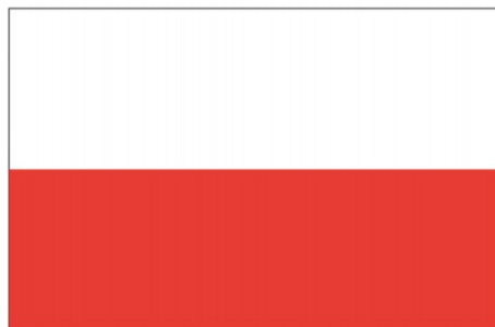
FLAGA PAŃSTWOWA RZECZYPOSPOLITEJ POLSKIEJ