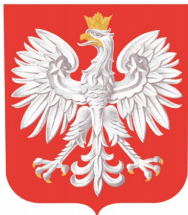
GODŁO RZECZYPOSPOLITEJ POLSKIEJ